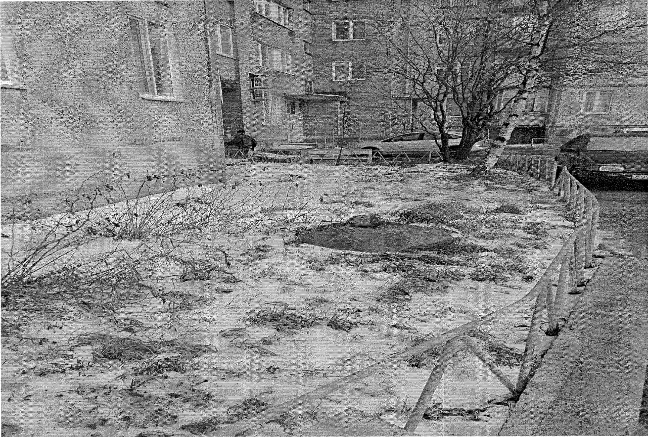
наб. Климентьева, д 15