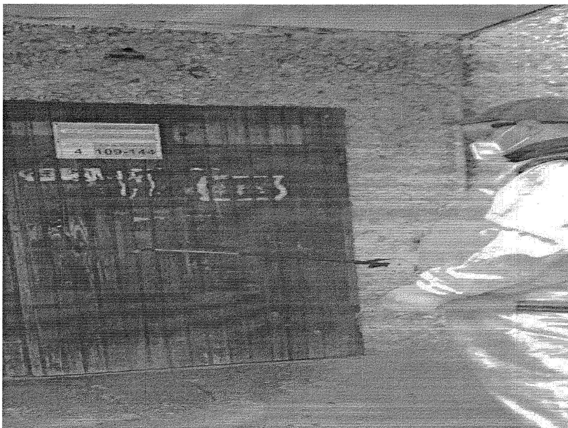
Ленинградская наб., д. 32/2