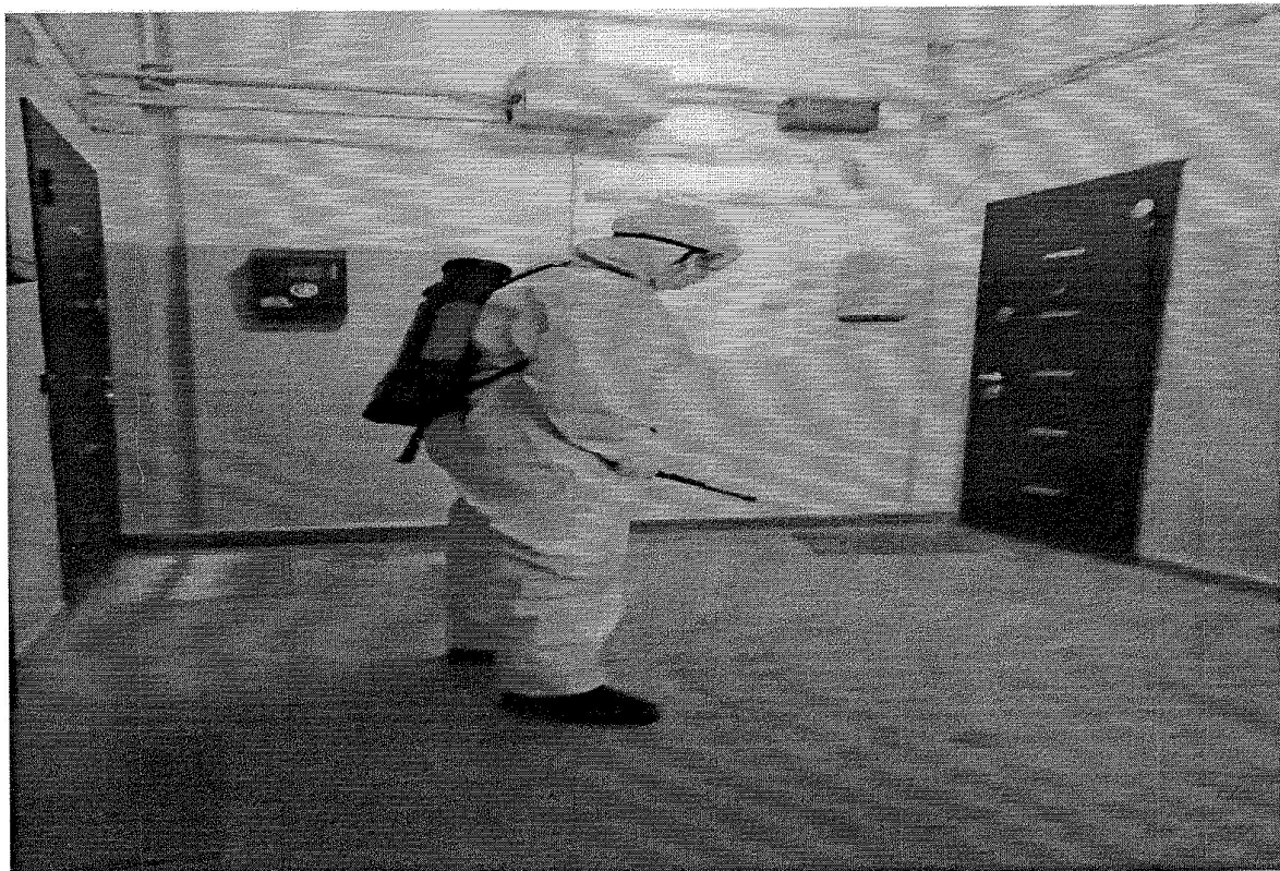
ул. Моршковая, д. 4