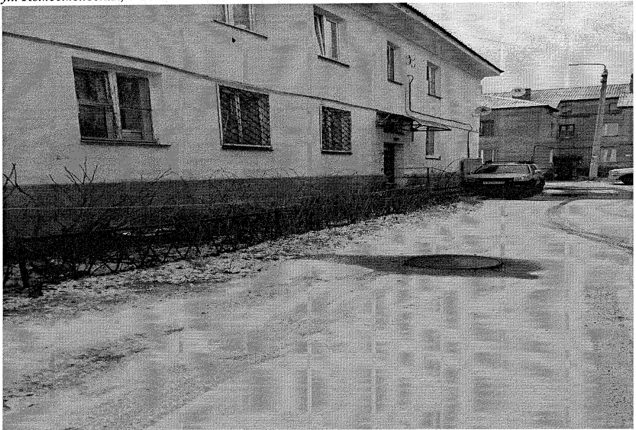
ул. Комсомольская, д 26 а