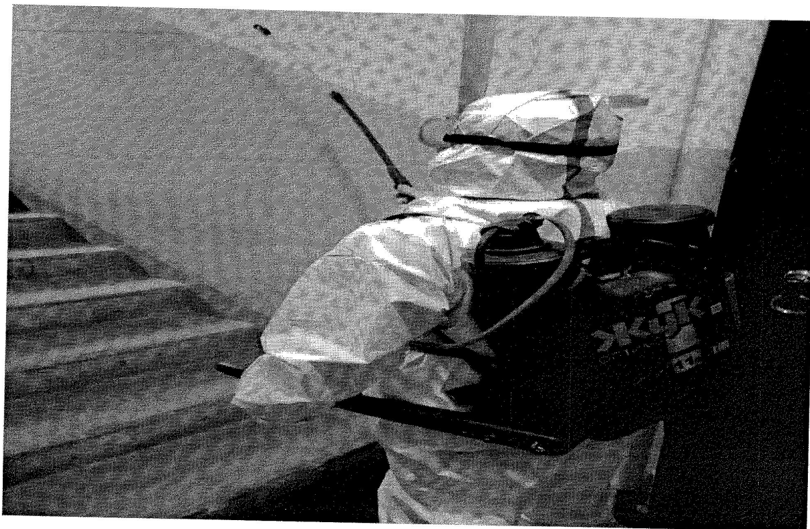
Лесная, д 14