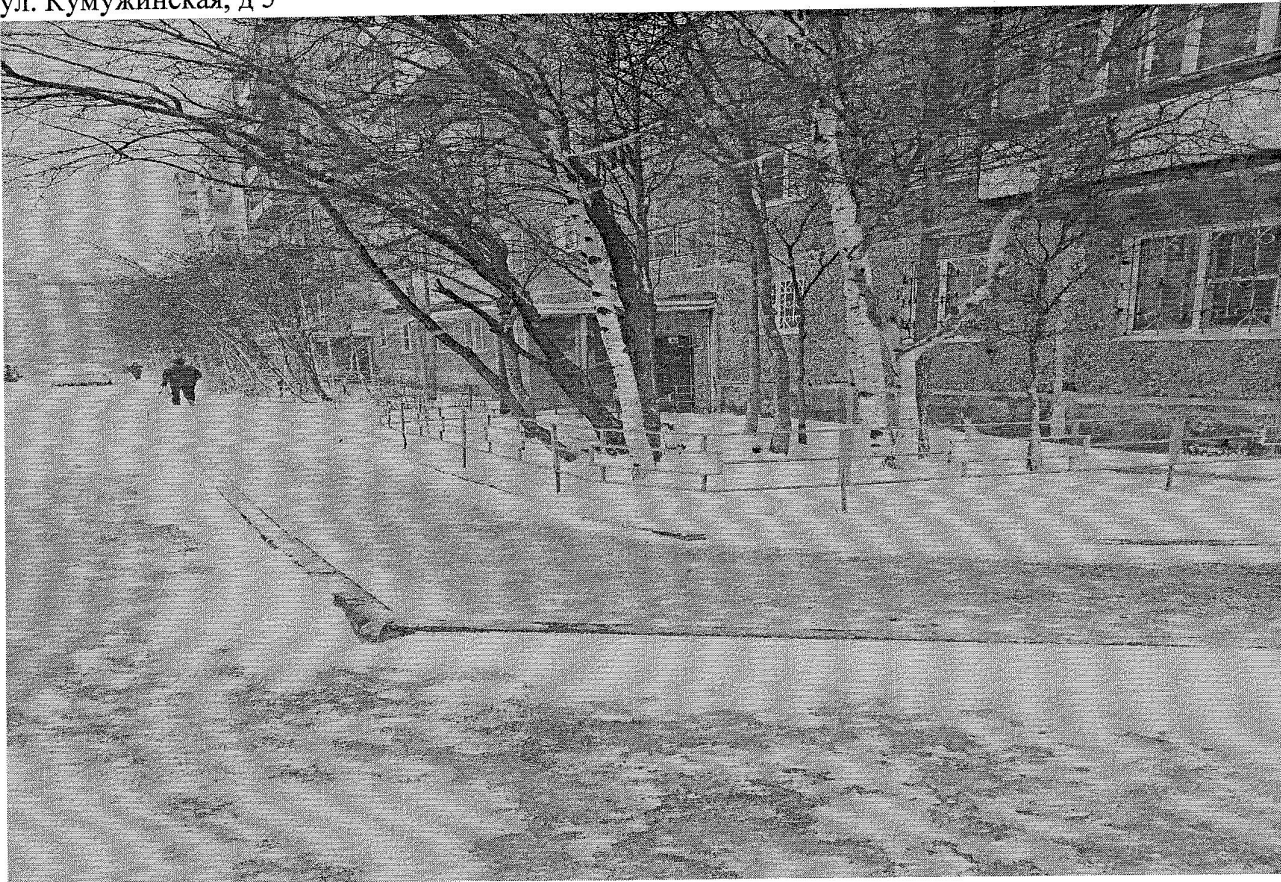
ул. Кумужинская, д 5