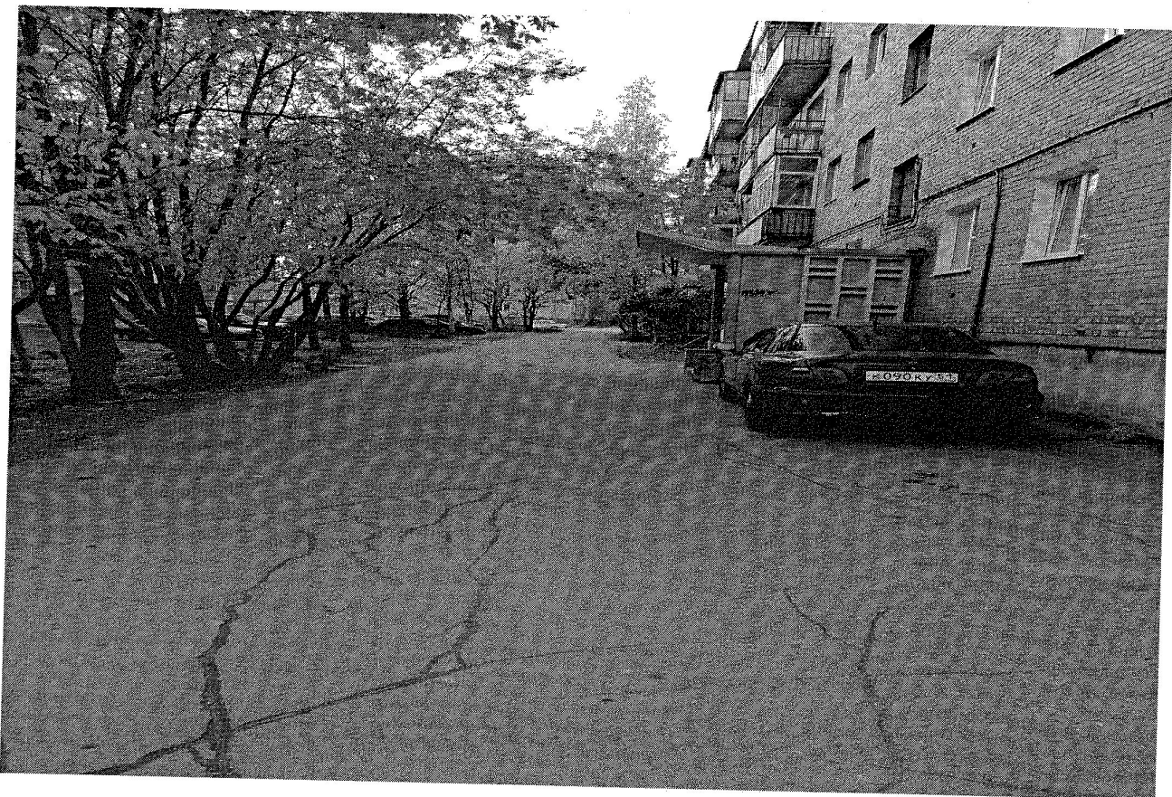
ул. Бредова, д 5 а